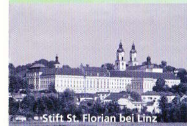
Stift St. Florian bei Linz