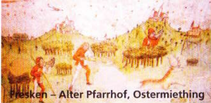
Fresken – Alter Pfarrhof, Ostermiething