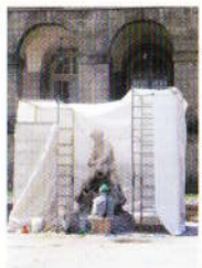
Brunnen Schloss Klesheim, Sbg.